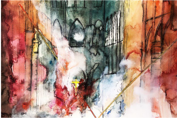
(Notre Dame – memories)

Night of fire (2019) encre et aquarelle sur papier 45x30 cm